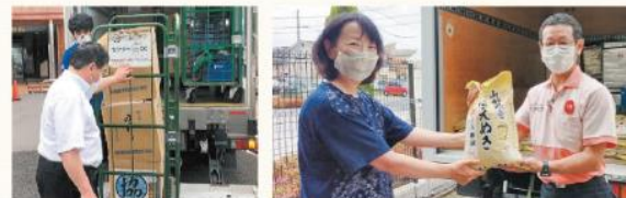
埼玉ではフードバンク埼玉を通じて支援