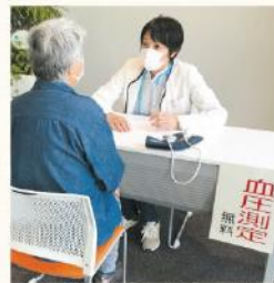
健康相談、血圧測定も同時開催

新型コロナウイルス感染拡大の影響で、子ども（多世代）食堂が開催できない状況が続いています。それに代わり、食料品をお渡しするフードパントリーを9カ所で開催、健康相談も行ってきました。