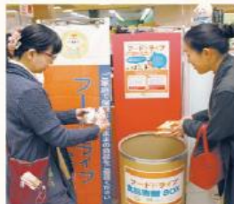
フードドライブ食品寄贈BOX

家庭で保管されたままの食品を寄贈していただく「フードドライブ」の取り組みを4月から新たに3店舗（コープ春日部店、コープ熊谷店、コープ深谷店）で開始、埼玉県内の実施施設は13カ所（組合員施設8カ所、店舗5カ所）となります。