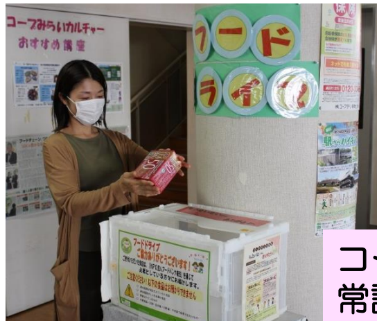
コープみらいの組合員施設の常設フードドライブ